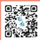
臺北市職能發展學院 QR CODE