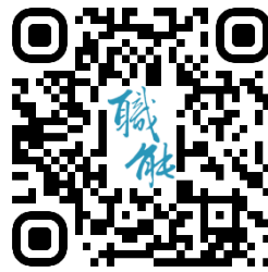
臺北市職能發展學院 官網